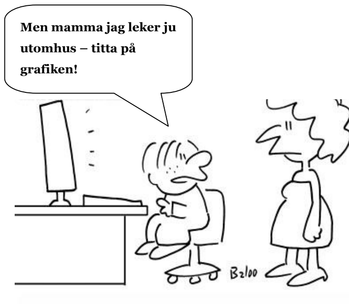
Barn i förhållande till dator, telefon, tv...